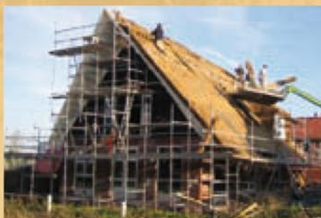
Ambachtelijk vakmanschap en efficiënte bedrijfsvoering gaan in de rietdekkersbranche hand in hand

Het maken van een rieten dak is een vak dat is voorbehouden aan specialisten. De Vakfederatie Rietdekkers zorgt er onder andere voor dat er een vakopleiding is voor rietdekkers. Het is een pittige en langdurige opleiding met zowel een theoretisch als een praktijkdeel. Diploma's worden uitgereikt na het behalen van het examen rietdekker in combinatie met ten minste drie jaar praktijkervaring. Alle rietdekkersbedrijven die zijn aangesloten bij de Vakfederatie zijn gediplomeerd.