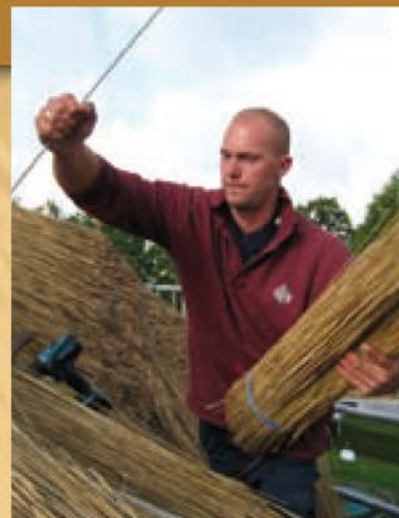
De kwaliteit van het riet en het vakmanschap van de rietdekker zijn mede bepalend voor de levensduur

Als u in de herfst in het polderlandschap rijdt, vormen de wuivende rietkragen met hun karakteristieke pluimen een prachtig decor. Datzelfde soort riet wordt al sinds mensengeugenis gebruikt als dakbedekking. Toch blijft riet voor velen een mysterie. Want hoe zit het met de levensduur, de kwaliteit, de isolatiewaarde, de brandveiligheid, etc? In vogelvlucht geven wij u in deze folder antwoord op de meest gestelde vragen.