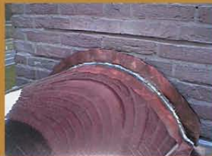
Koperen nokvorsten voor rieten daken