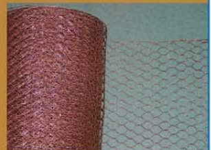
tevens verkoop kopergaas